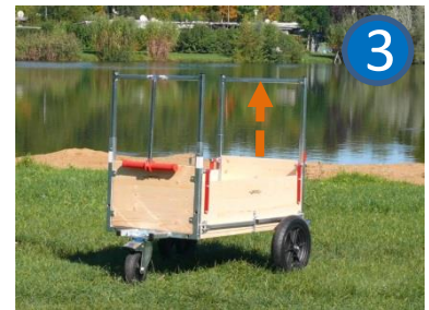
Den zweiten Querbügel hochziehen bis er einrastet