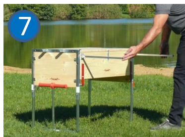
Stützen bis zum Anschlag aufklappen