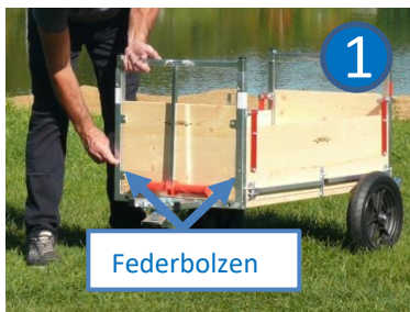
Die beiden Federbolzen am Grundrahmen entriegeln...