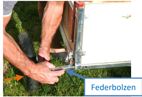
Montage eines Hinterrades