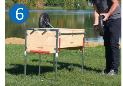
Hinterräder per Federbolzen abnehmen