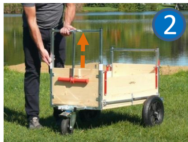
...und den Querbügel hochziehen bis er einrastet