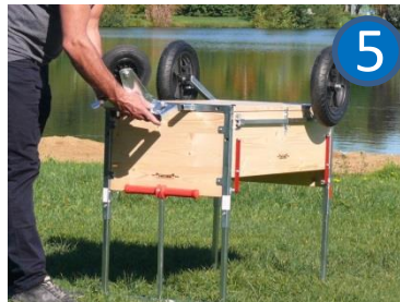
Vorderrad per Federbolzen lösen